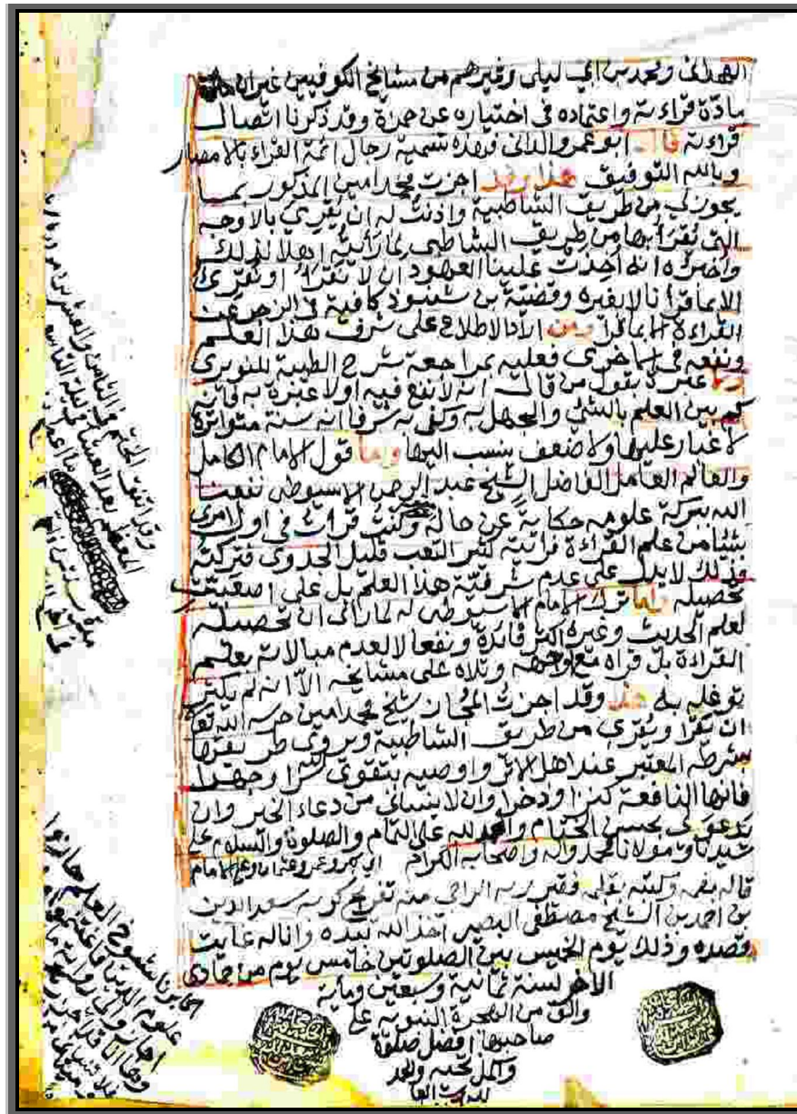
الصفحة الأخيرة من إجازة الشيخ محمد أمين آل شيخ القراء الموصل