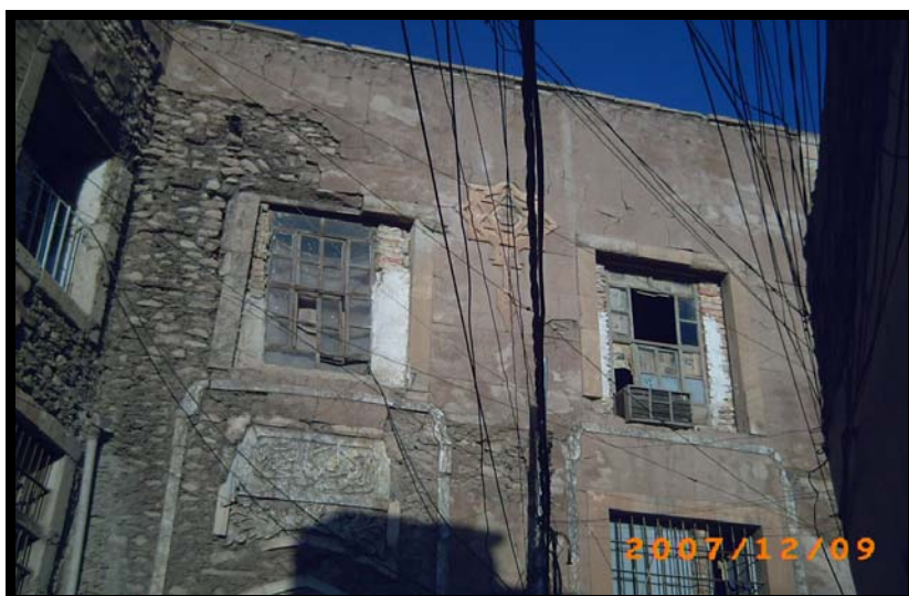
البناية التي رممها الجامع للمهجريين