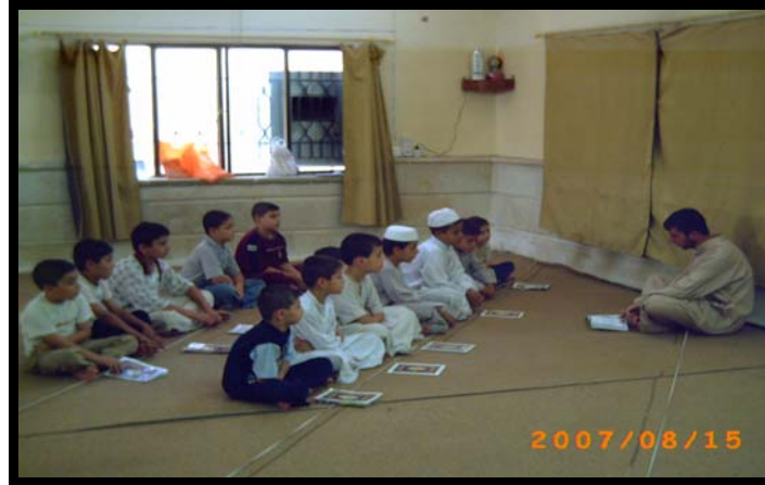
احدى الدورات التعليمية