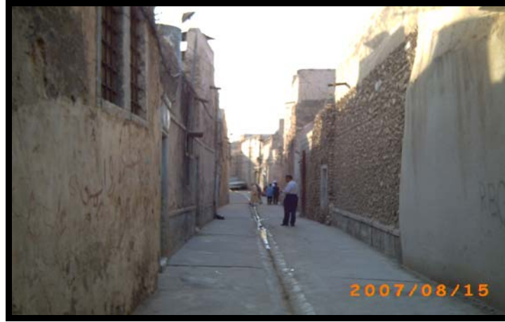
الزقاق الذي يصل بين جامع المحسنين وجامع الحامدين