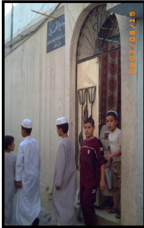
الباب الخلفي للجامع