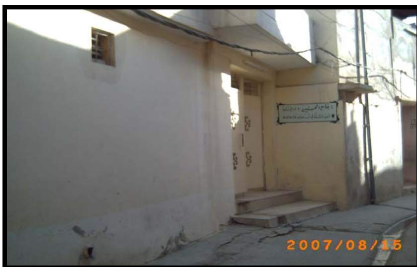
الجامع ملاصق لبيوت المحلة