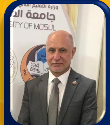
أ.د. ظافر محمد عزيز رئيساً