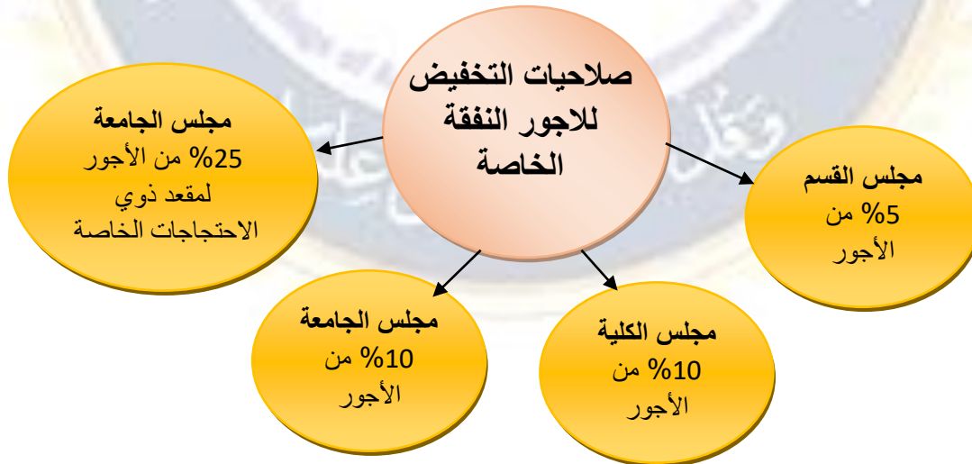
الشكل (2) صلاحيات التخفيض لأجور النفقة الخاصة

الخاصة / النفقة الخاصة بنسبة 25% من المبلغ الكلي للأجور