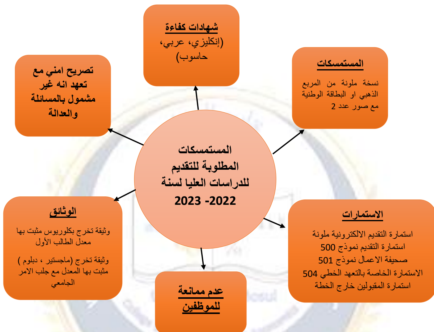
الشكل (1) المستمسكات المطلوبة للتقديم للدراسات العليا لسنة 2023 - 2022