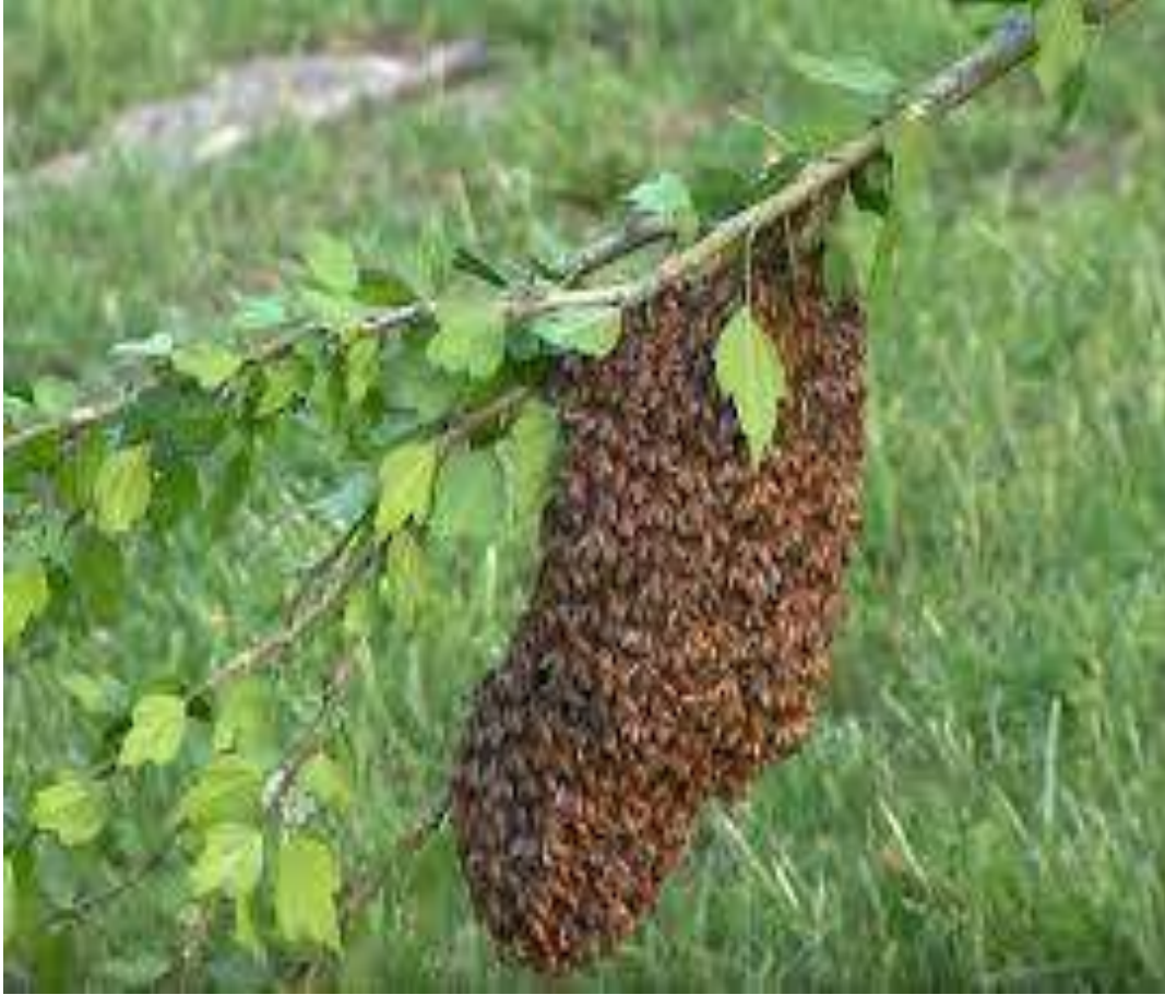
طرد نحل معلق بغصن شجرة