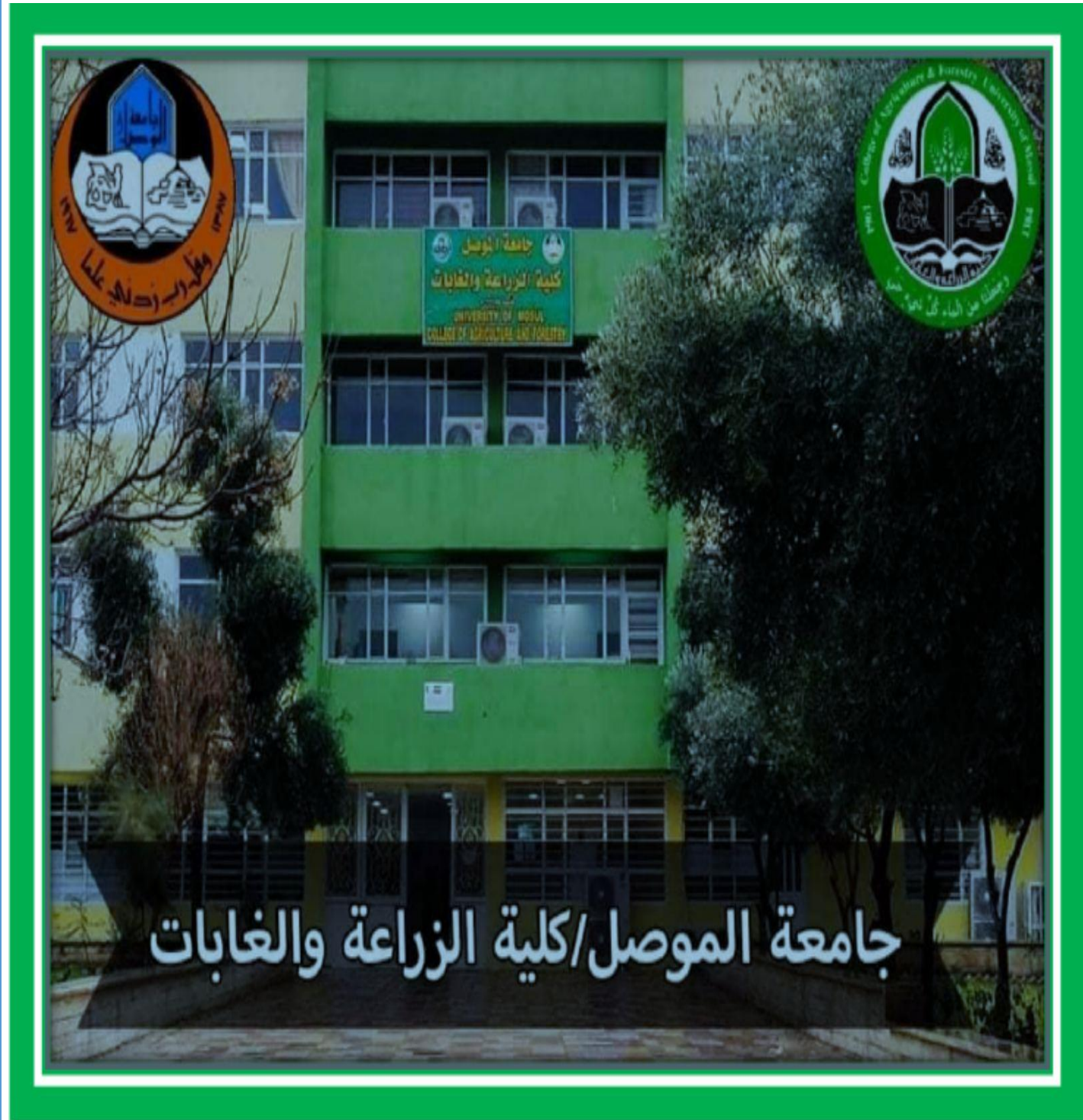
جامعة الموصل - كلية الزراعة والغابات