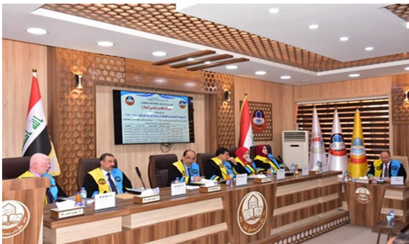
صورة لأحدى مناقشات أطروحة الدكتوراه