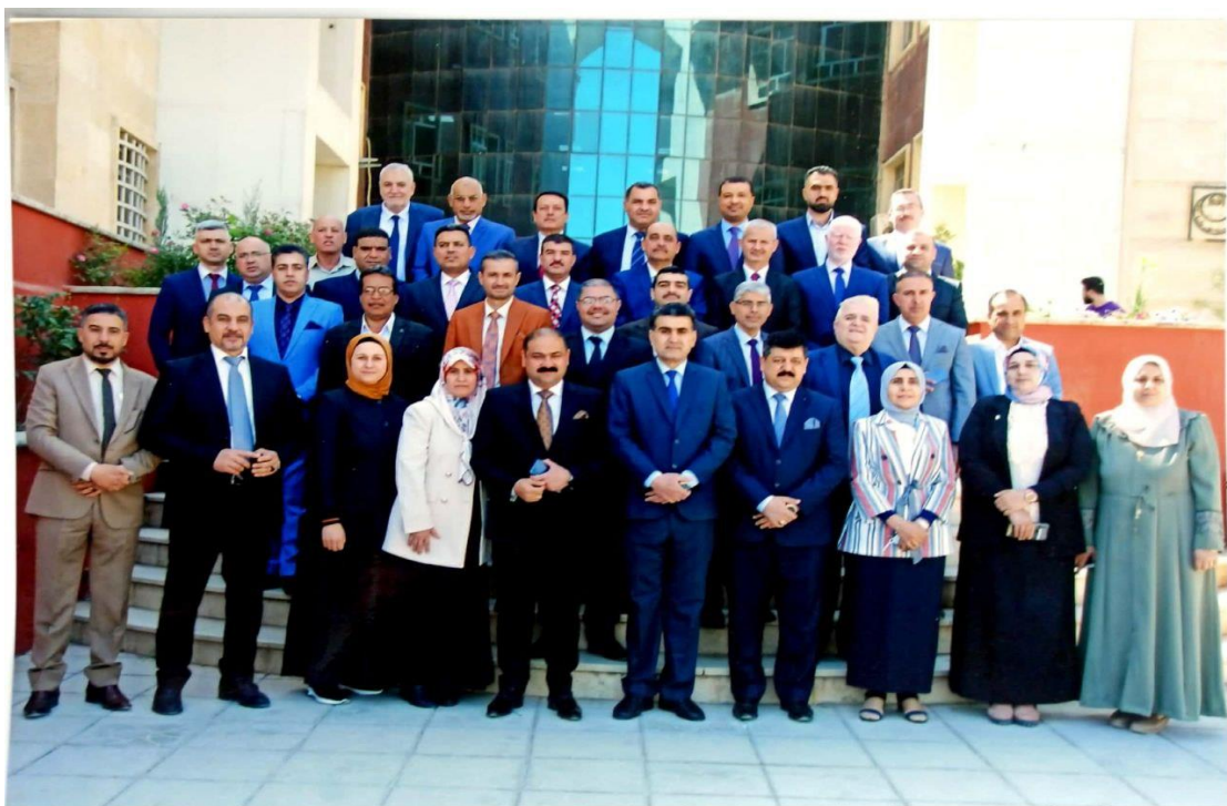
أعضاء الهيئة التدريسية في قسم التاريخ