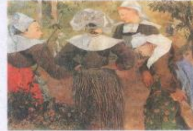
Quatre femmes bretonnes, Gauguin