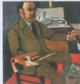
Un Océanide, Matisse

L'œuvre de Gauguin a inspiré Henri Matisse, lui-même considéré comme le maître du fauvisme et comme une des figures majeures du XX e siècle. Il a été très important pour la peinture de la seconde partie du siècle dernier (figurative et abstraite). *