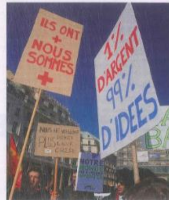
Manifestation devant la bourse (15 octobre, 2011)

Dans leur livre Pas si fous ces Français ! , deux journalistes canadiens racontent deux années passées en France afin d'observer et de comprendre nos habitudes et notre mentalité contestataire. Et ce que l'on y apprend peut nous étonner, voire bousculer les stéréotypes sur les Français.