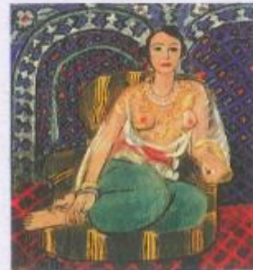
Une Océanide, Matisse

Des voyages de Matisse, il faut retenir l'Andalousie, le Maroc et l'Algérie, où les couleurs et les céramiques ont développé chez lui un goût pour l'art décoratif. Il a également réalisé de nombreux voyages aux États-Unis. Mais c'est la lumière d'une autre île, Tahiti, qui l'a inspiré. *