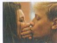
Morming (2014), Xavier Dolan

Avec un regard tendre et sensible, Xavier Dolan cherche à nous livrer un portrait subtil et réaliste ; il veut que nous prenions conscience de la complexité des liens qui peuvent nous unir.