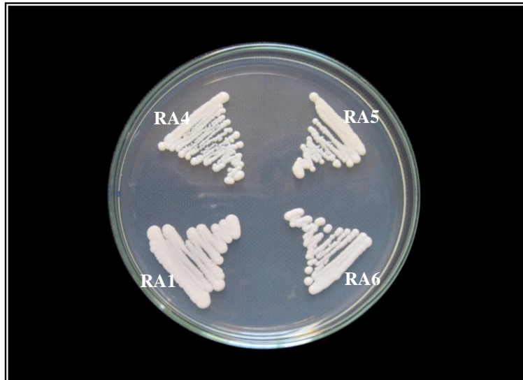
الصورة (4-5) اربع عزلات من خميرة الـ C. albicans نامية على الوسط SDA عند درجة الحرارة 45م° ولفترة 48 ساعة