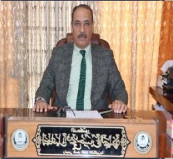
الأستاذ المساعد الدكتور

أدعوكم أبنائي إلى الصدق في النية والإجتهاد في العمل والتشميمير في تحصيل العلم كي تتحملوا مسؤولياتكم في بناء العراق كل من موقعه ورفد المؤسسات التعليمية والتربوية بالطاقة الإيجابية وطرائق التدريس الحديثة رفعا للمستوى العلمي والتربوي لأبنائنا ختاماً، دعائي لكم بالتوفيق والسداد.