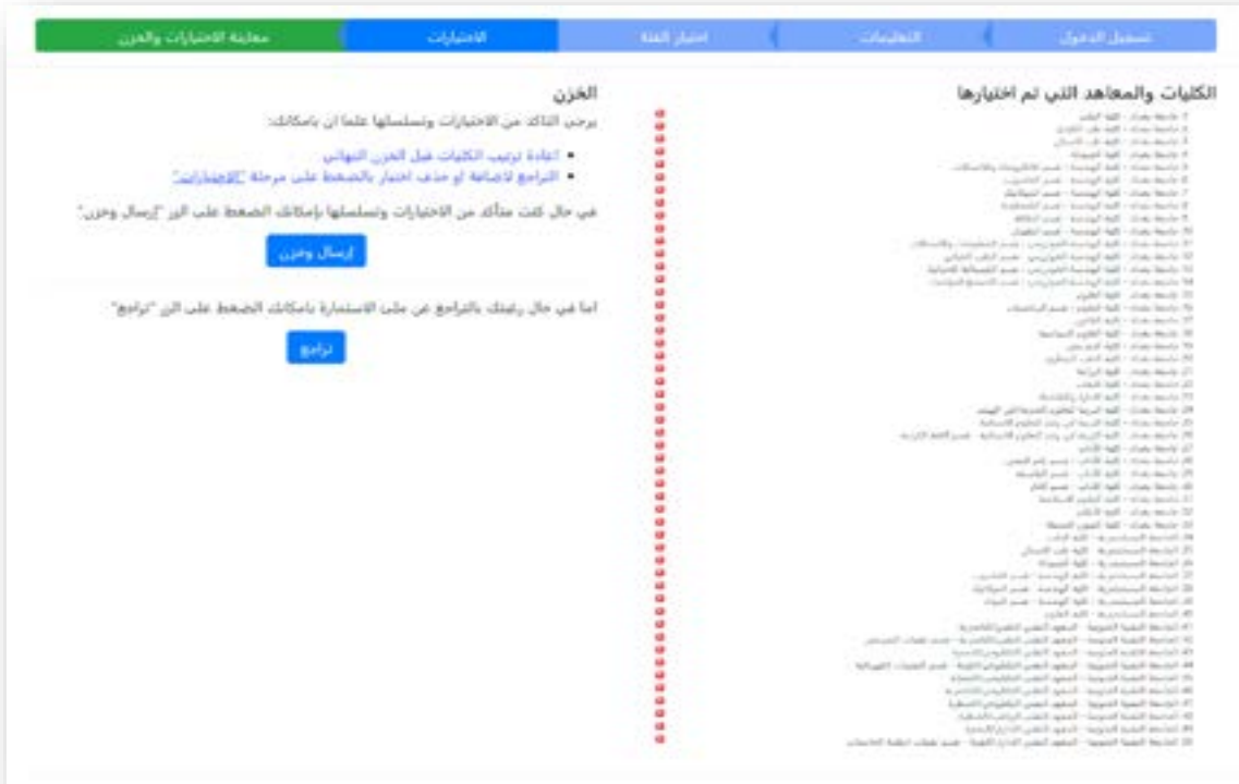
الشكل رقم (١٢) معاينة الإختيارات والخرن

تم إنشاء الصفحة الموضحة في الشكل رقم (١٢) أعلاه لمعاينة الإختيارات التي ملأها الطالب في الخطوة السابقة قبل الإرسال والخرن النهائي لتسهيل الإجراءات على الطالب وإعطاء فرصة أخرى لتعديل خياراته أو تعديلها.