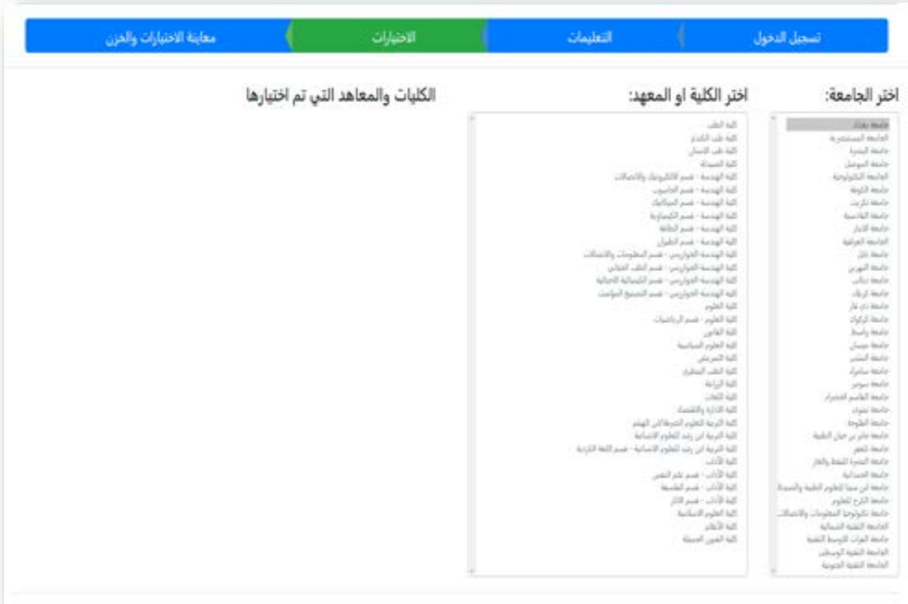
الشكل رقم (٧) الصفحة الخاصة بتحديد الإختيارات

وبعد الضغط على زر (الإختيارات) من شريط مراحل الملء سوف تظهر الصفحة الخاصة بتحديد الإختيارات كما في الشكل رقم (٧).