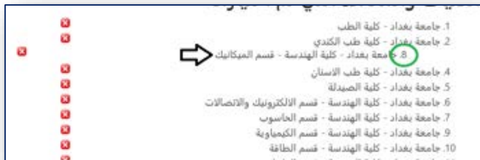
الشكل رقم (١٠) سحب الإختيار المراد تغييره الى التسلسل المطلوب