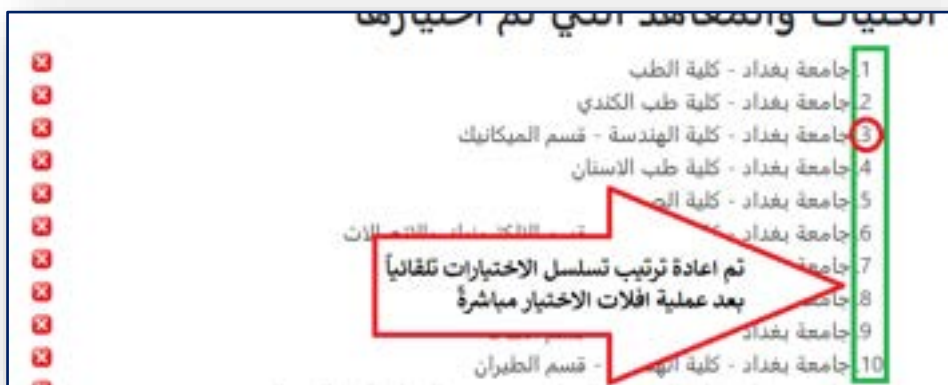
الشكل رقم (١١) إعادة ترتيب الإختيارات تلقائياً