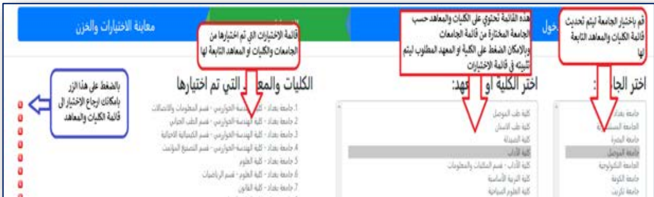
الشكل رقم (٨) قائمة باسماء الجامعات والكليات والمعاهد التي تم إختيارها من قبل الطالب

وهي أهم صفحة ، لذلك يجب عليك عزيزي الطالب الإلتباه جيداً الى كيفية تحديد إختياراتك والدقة في تثبيت إختيار صحيح على حسب الترتيب الذي ترغب به ، تم تصميم هذه الصفحة بشكل مبسط وسهل إذ تحتاج فقط إختيار اسم الجامعة التي ترغب بإختيار كلية او معهد منها لتظهر لك قائمة بجانبها تتضمن الكليات والمعاهد التابعة لهذه الجامعة وكما هو مبين بالشكل رقم (٨).