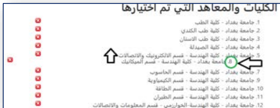
الشكل رقم (٩) تغيير تسلسل الإختيار