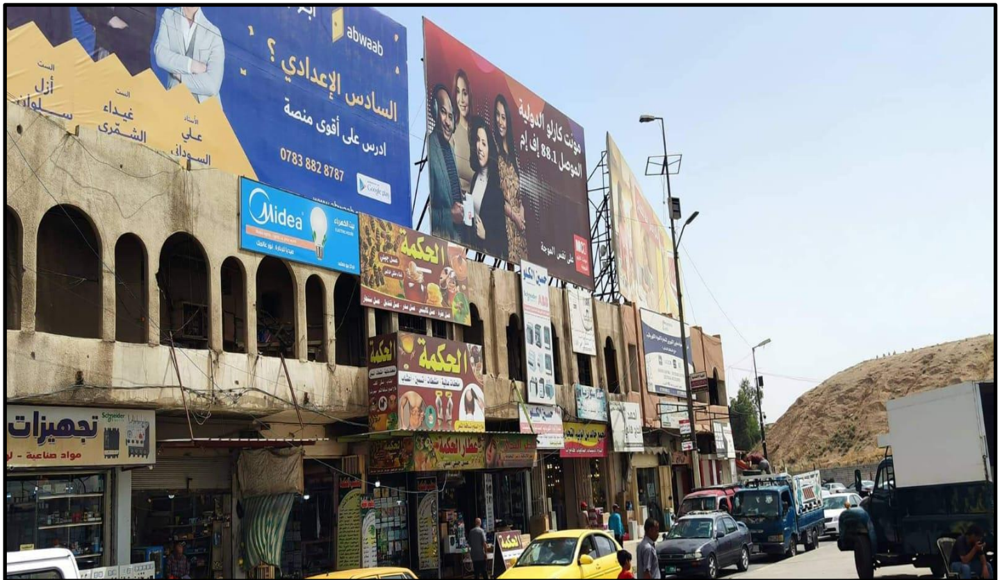
الشكل رقم (٨)