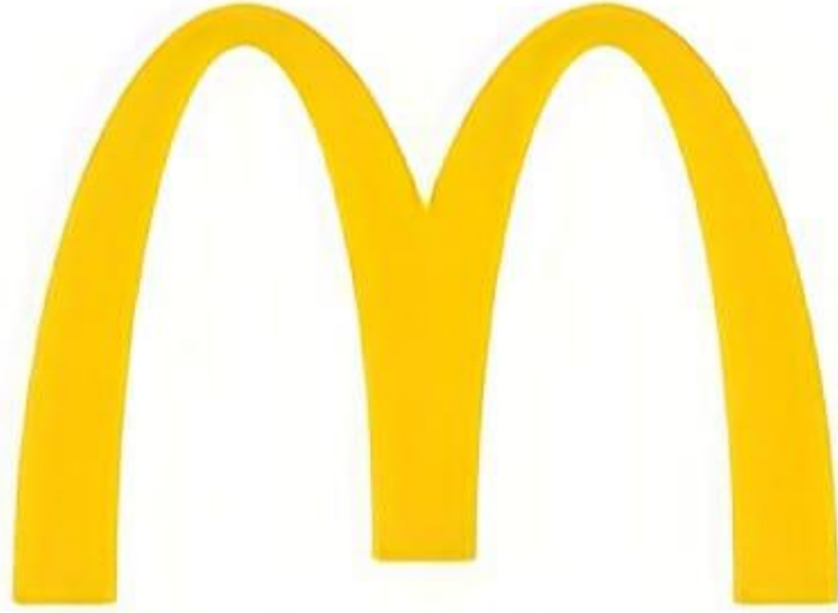
الشكل ( ١ ) : شعار سلسلة مطاعم ماكدونالد (McDonald's)