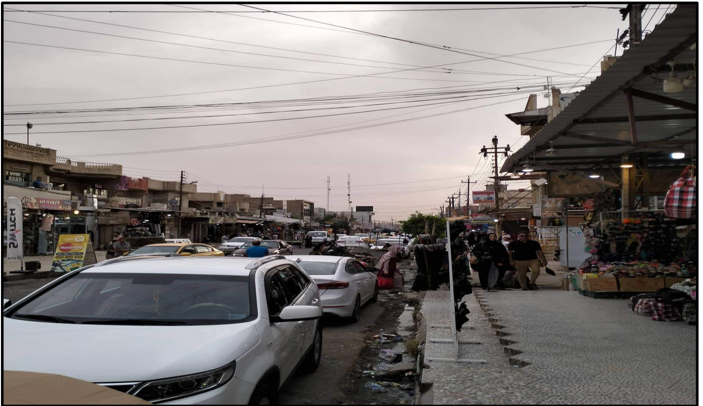
الشكل رقم (١٠)