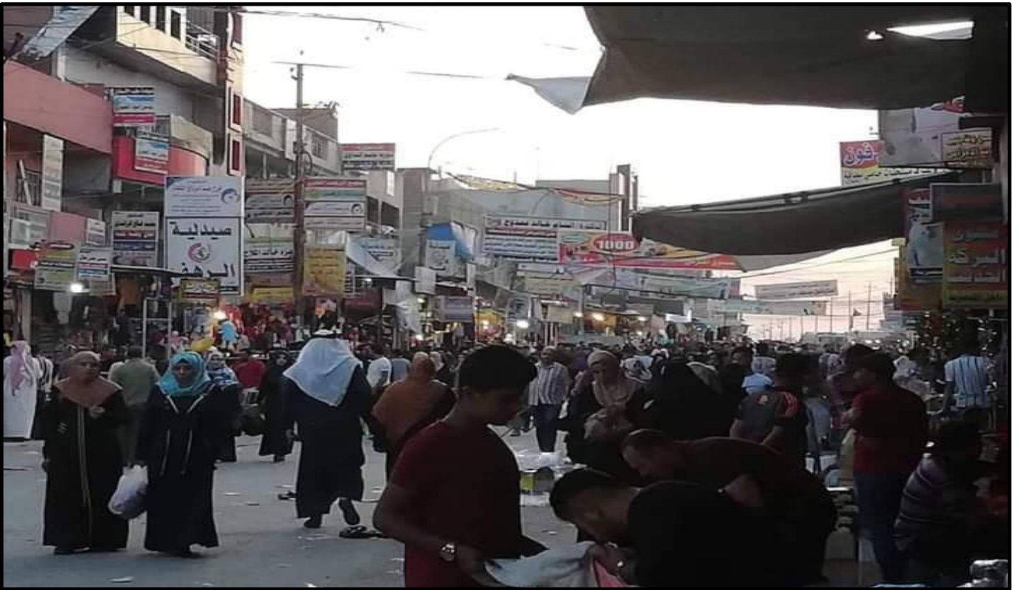
الشكل رقم (٦)