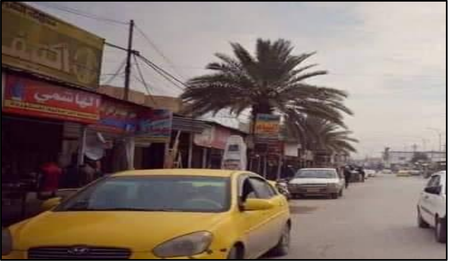
الشكل رقم ( ١١ )