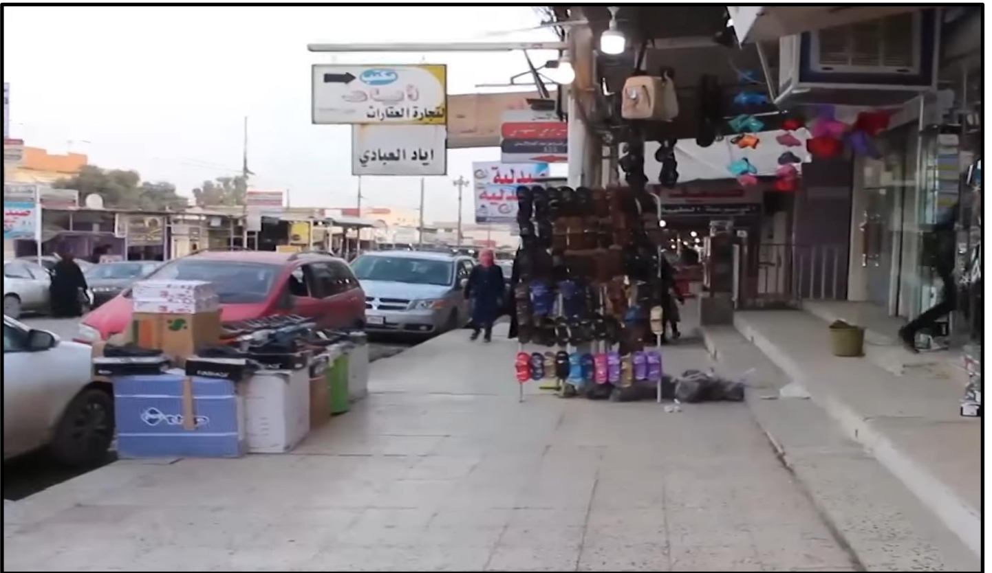
الشكل رقم ( ١٢ )