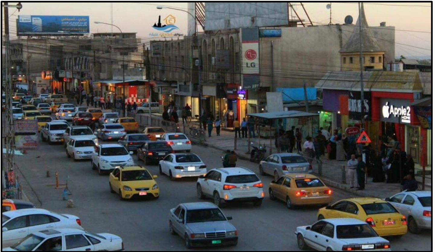
الشكل رقم (١٤)