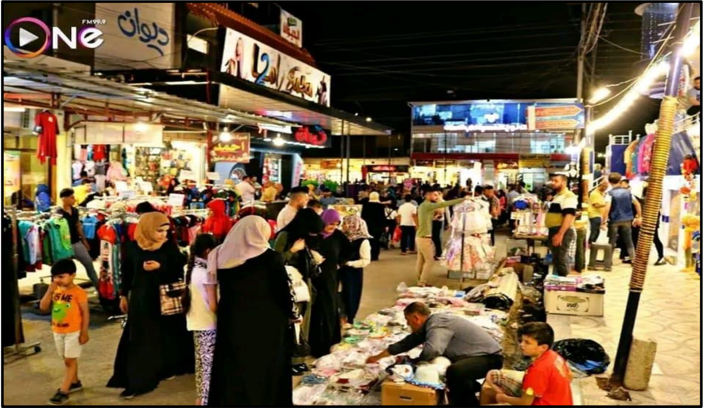
الشكل رقم (١٣)