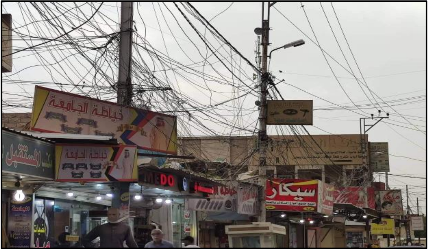
الشكل رقم (٧)