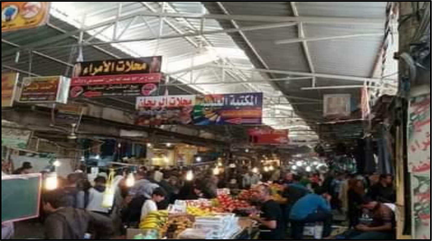
الشكل رقم (٥)