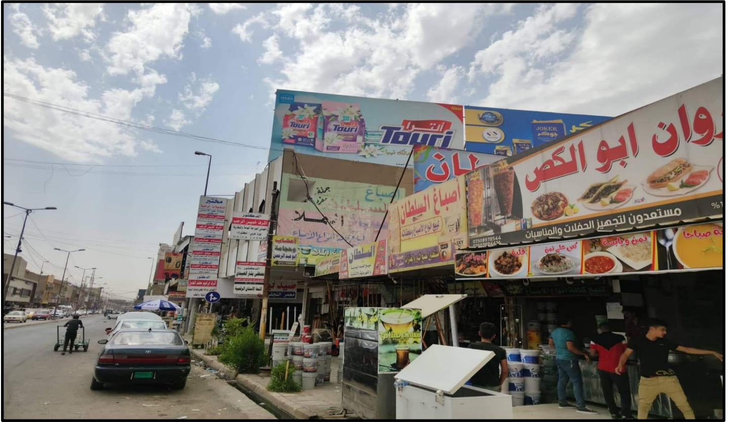
الشكل رقم (٩)