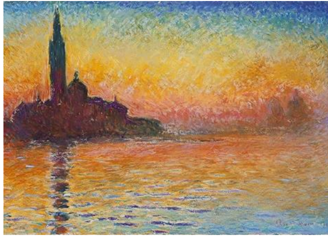
(لوحه سان جورجيو ماجيوري عند الغسق )