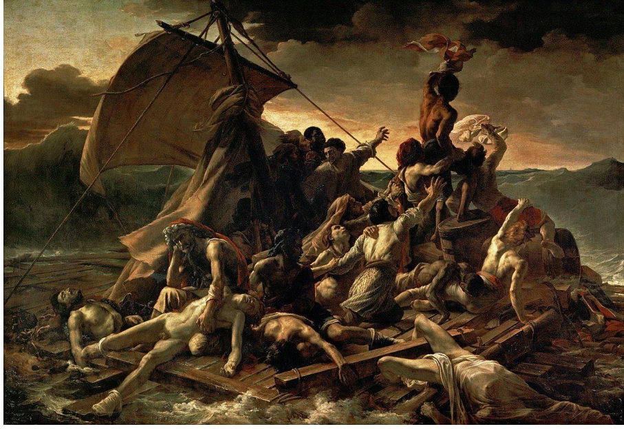
( لوحة طوف الميدوزا للفنان تيودور جيريكو )

توفي جيريكو عن عمر (33) عام قبل ان يشاهد اعمال كونستابل في المعرض العام ( 1824 ) . بعدها استلم راية الرومانتيكية ( ديلاكروا ) .