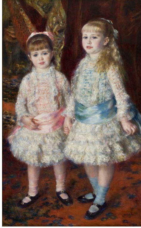
( لوحه أزرق و وردى للفنان رينوآر )