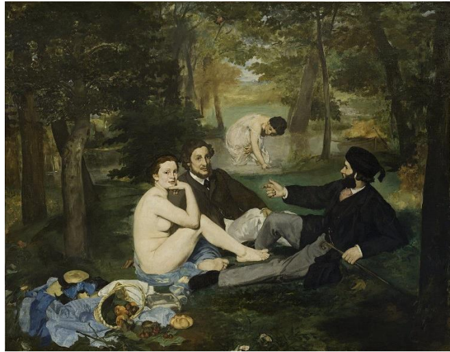
( لوحة الغداء على العشب للفنان ادوارد مانيه )

من اعماله ( الغداء على العشب 1863 ) خلقت هذه اللوحة ضجة كبيرة في صالونات العرض حتى انه الامبراطور نفسه وصفها بالغير محتشمة , سبب الرد العنيف هذا هو تصويرها حياة عصرية جريئة دون تبرير اسطوري .