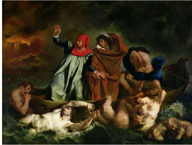
( لوحة قارب دانتي للفنان ديلاكروا )

تأثر ديلاكروا بالوحة طوف الميدوزا التي شاهدها في صالون 1819 و بعد 3 سنوات عرض لوحة ( قارب دانتي ) شخصيات في لوحته تفيض بالحيوية و قوة درامية والأمواج تتلاطم حولها ، في عام ( 1824 ) قدم لوحة تصور المجازر التي ارتكبها الاتراك في جزيرة اليونانية بعنوان ( مذبحة ساقز ) تحدى ديلاكروا الكلاسيكية التي تعد ( الرسم أي الخط هو أساس فن التصوير ) جاعلاً اللون أدواته المباشرة لخلق الشكل .