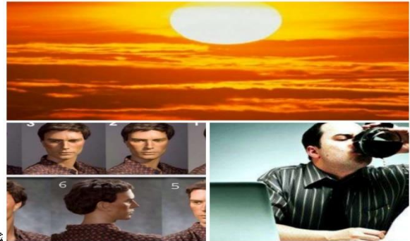
شكل 4 شكل 5 شكل 6