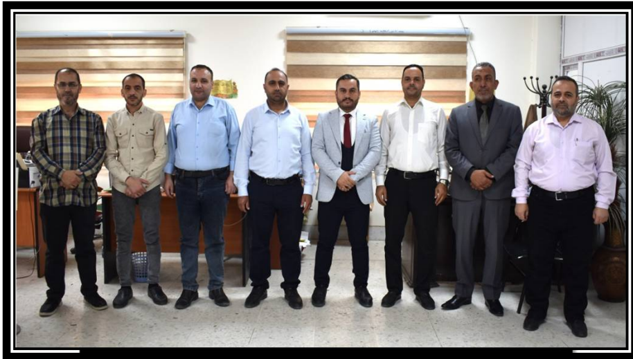
كادر شعبة التسجيل