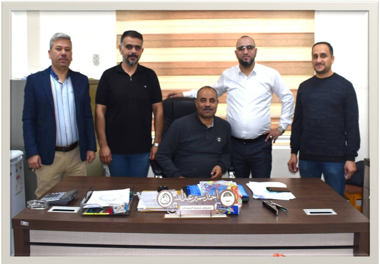
كادر شعبة الحسابات

استحدثت شعبة الحسابات مع استحداث الكلية في عام ٢٠٠٤ مهامها تغطية كافة مصاريف الكلية وصرف رواتب الأساتذة والموظفين المنسبين للعمل في الكلية وتتألف من مدير شعبة الحسابات وخمسة موظفين من حملة شهادة البكالوريوس في المحاسبة وهي مرتبطة إدارياً مع السيد معاون العميد للشؤون الإدارية والمالية .