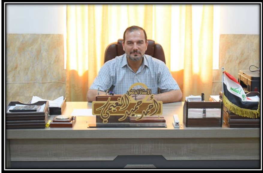
أ.د. أحمد حميد سعيد رئيس قسم الحديث وعلومه