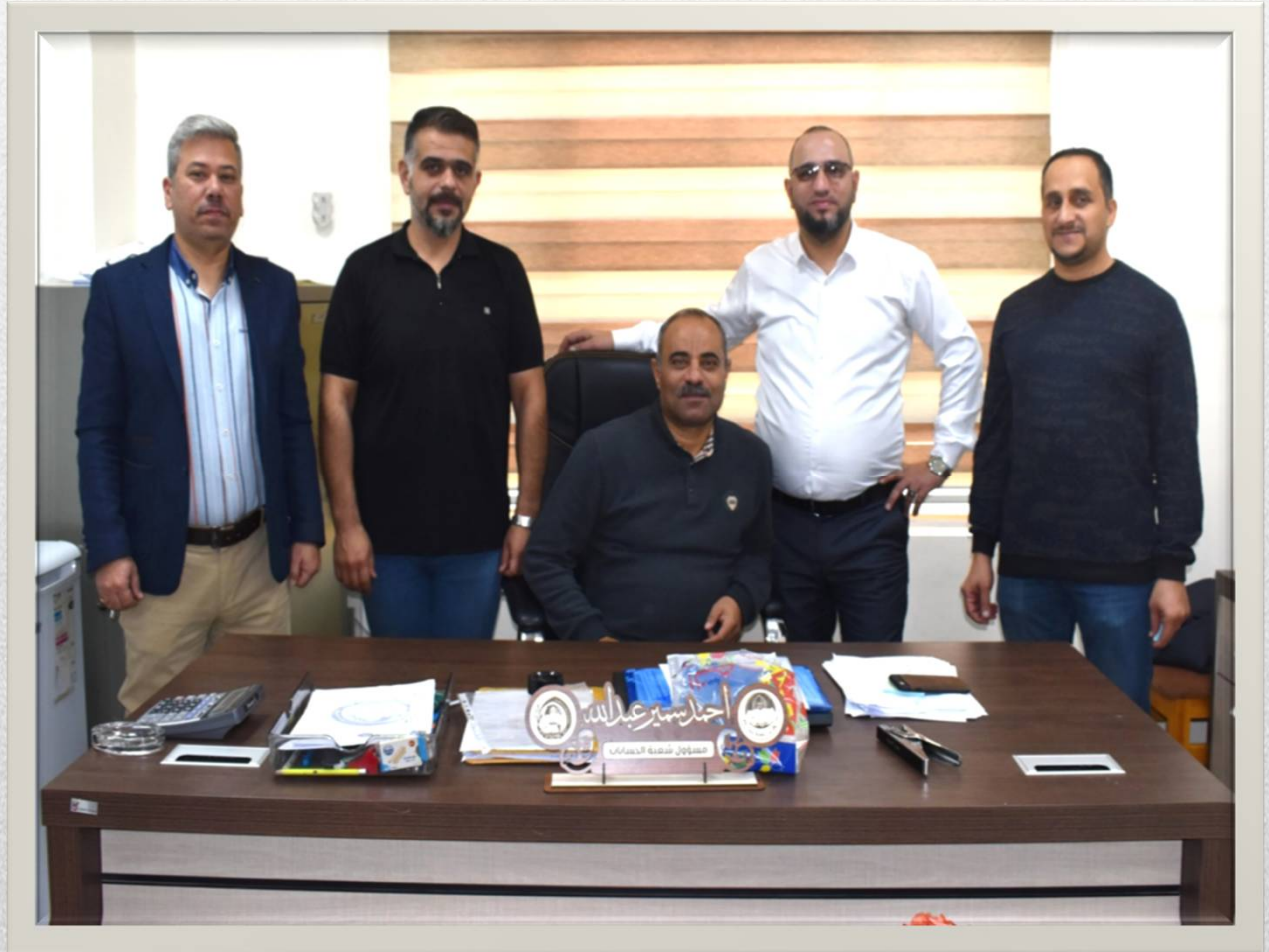
كادر شعبة الحسابات

استحدثت شعبة الحسابات مع استحداث الكلية في عام ٢٠٠٤ مهامها تغطية كافة مصاريف الكلية وصرف رواتب الأساتذة والموظفين المنسبين للعمل في الكلية وتتألف من مدير شعبة الحسابات وخمسة موظفين من حملة شهادة البكالوريوس في المحاسبة وهي مرتبطة إدارياً مع السيد معاون العميد للشؤون الإدارية والمالية .