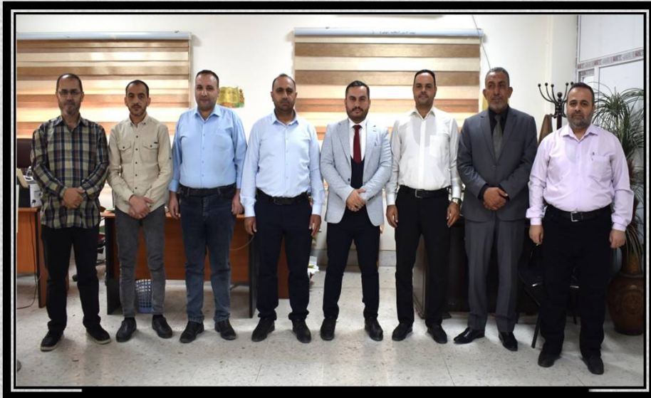
كادر شعبة التسجيل