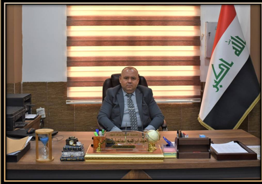
أ.د. أحمد إبراهيم إسماعيل رئيس قسم الشريعة