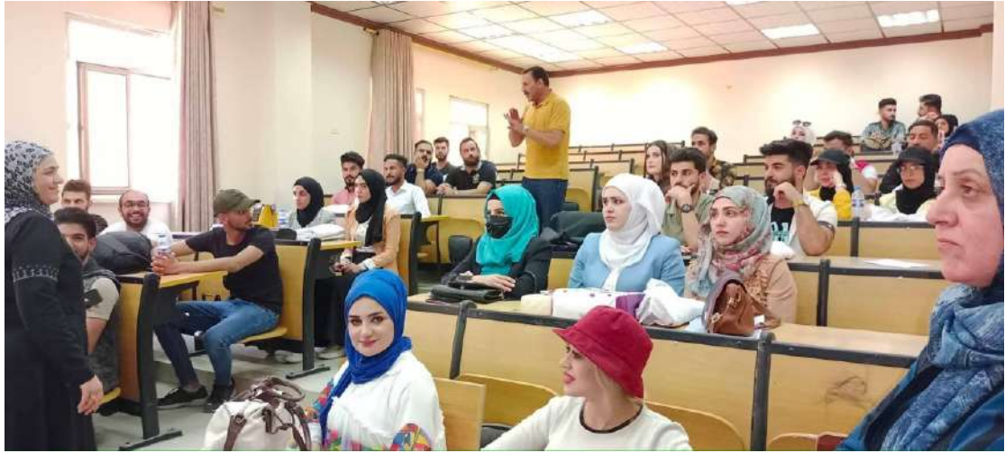
◀ ورشة عمل الية العمل على تطوير وتنمية المهارات الذاتية للطلبة وضمن نشاطات وحدة التأهيل والتوظيف. 2022/4/10