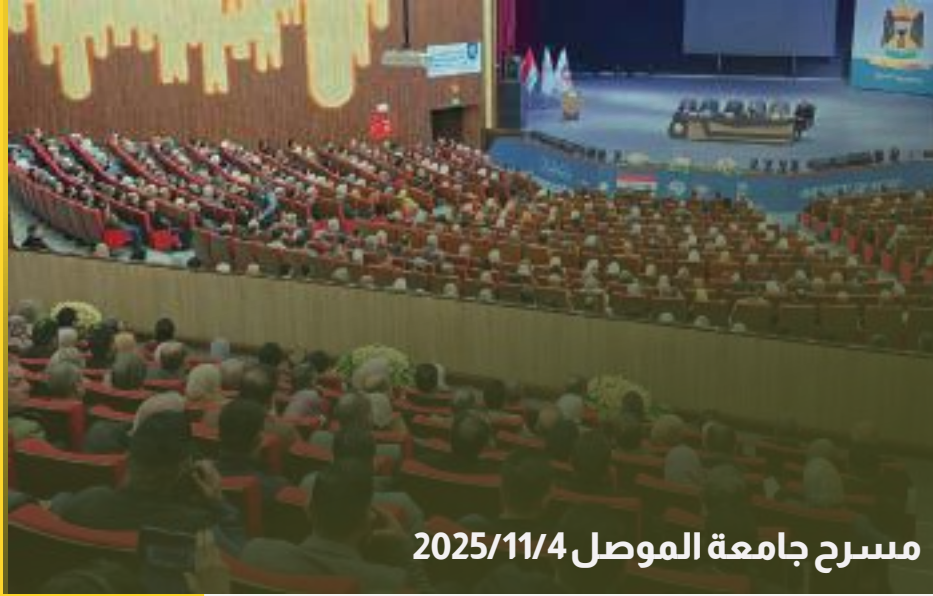
مسرح جامعة الموصل 2025/11/4