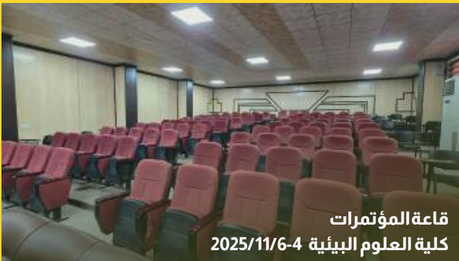
قاعة المؤتمرات كلية العلوم البيئية 2025/11/6-4