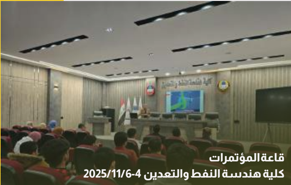
قاعة المؤتمرات كلية هندسة النفط والتعدين 2025/11/6-4