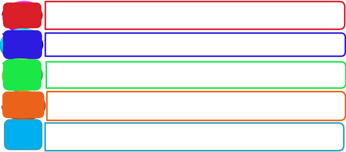
شكل (1) اقسام الدليل