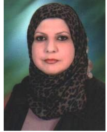
سابعاً: اعمار المركز:

يهدف البحث التعرف على مدى إسهام مدرسة الأوائل الأهلية في تنمية العملية التعليمية لطلبتها من خلال دراسة ميدانية طبقت على المدرسة، وقد توصل البحث الى إسهام المدرسة في تنمية العملية التعليمية من خلال توفير البيئة التعليمية الجيدة والملائمة لطلبتها فضلاً عن الأساليب التدريسية من قبل الكادر التعليمي الى جانب الوسائل التعليمية الحديثة في عملية التعليم.