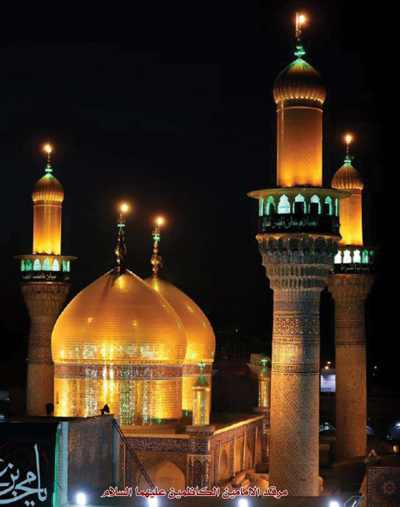
مرقد الامامين الكاظمين عليهما السلام