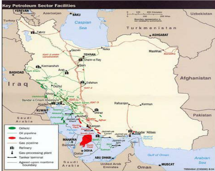
ألوان الأخضر حقول النفط و ألوان لاحمر حقول الغاز

ويمكن تقييم حدود إيران على الخليج العربي من خلال دراسة باقي الحدود الإيرانية، فمن الشمال توجد روسيا الاتحادية وبحر قزوين الغني بالنفط والغاز، وهذه المنطقة تحولت بعد تفكك الاتحاد السوفيتي مركز لجذب القوى الدولية، وما يثير قلق إيران في هذا المجال هو الدخول الأمريكي على خط التنافس وبذلك أصبحت المنطقة المحايدة لشمال إيران هي منطقة صراع ومحل تنافس الدول الكبرى والدول الإقليمية (١٧) ، وإلى الشرق هناك أفغانستان في ظل عدم الاستقرار بسبب الاحتلال الأمريكي مع تواجد قوات حلف النيتو (١٨) ، وإلى جانب ذلك تواجه إيران باكستان بكل اتساعها وضخامة عدد سكانها الذين يتجاوزن (١٨٠) مليون نسمة فضلا عن كونها قوى نووية وشريك استراتيجي للولايات المتحدة، ومدارسها الدينية ارض خصبة لحركة طالبان، والخلاف المذهبي يتخذ أحيانا طابعا عنيفا (١٩) ، وفي الغرب هناك تركيا العضو في حلف الشمال الأطلسي (٢٠) ، والعراق الذي كان يعد احد القوى الإقليمية في الخليج و الان تربطه اتفاقية إستراتيجية طويلة الأمد مع الولايات المتحدة الأمريكية (٢١) .