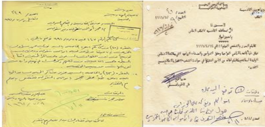
صورة (٢-١١) تبين مصادرة أموال عراقيين لمشاركتهم في الانتفاضة الشعبانية