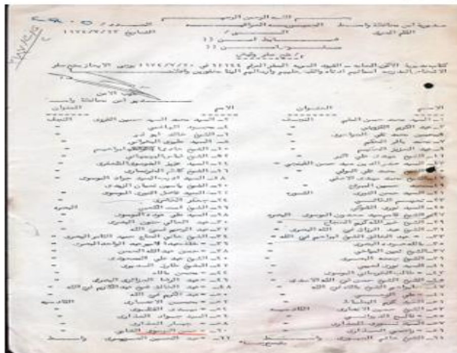
صورة (٢ - ٩) وثيقة تبين منع سفر رجال دين من العراقيين وغيرهم