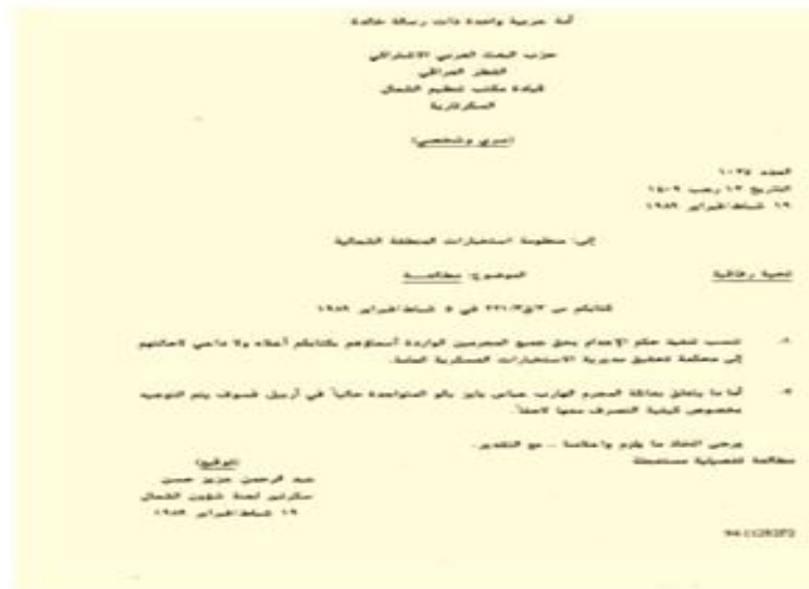
صورة (٢ - ٨) وثيقة تبين إعدام المواطنين من دون محاكم (المصدر: الأمم المتحدة).