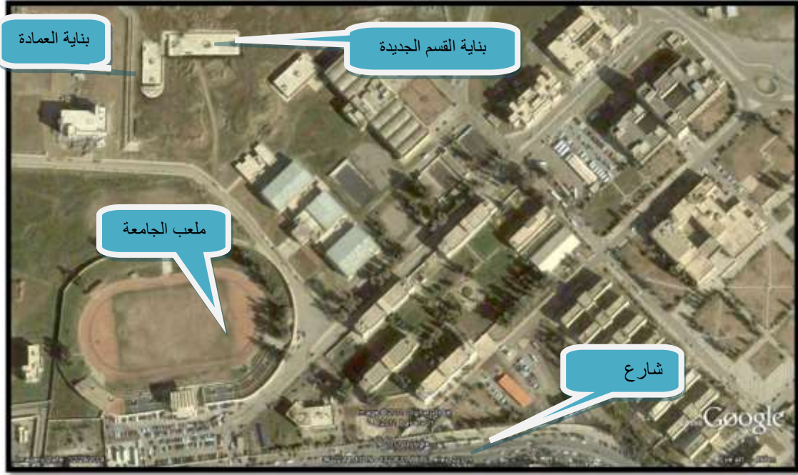
تحديد موقع قسم اللغة العربية في البنية الجديدة من الجو