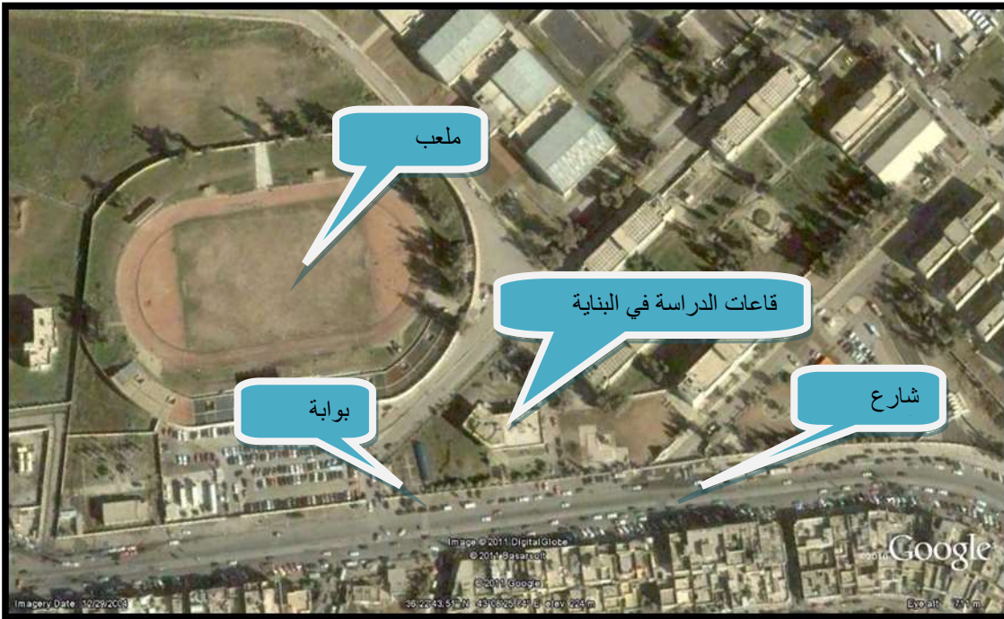
تحديد موقع قسم اللغة العربية في البنية القديمة من الجو