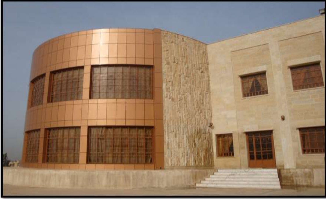
صورة بناية عمادة كلية التربية للبنات