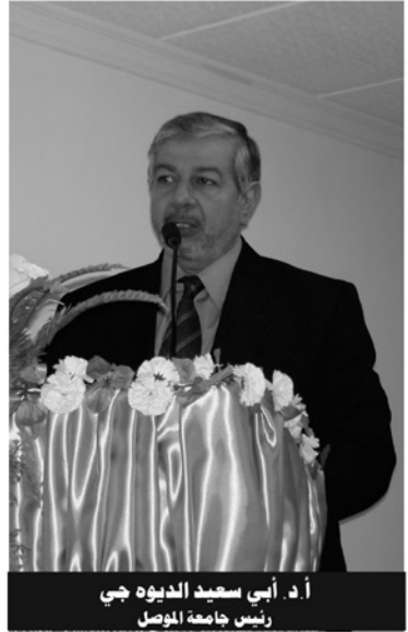
أ. د. أبي سعيد الذبيوه جي رئيس جامعة الموصل

لعل أبرز ما تتميز به الدول المتقدمة حرصها الدائم على استمرار مواكبة قوانينها للتغيرات