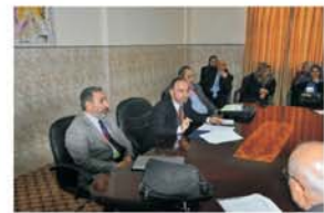
الموصل وكلية الزراعة والغابات بأقسامها المختلفة يعقد الندوات والمؤتمرات المتخصصة لمناقشة واقع القطاع الزراعي

هما المسيبان للمشكلة الاقتصادية وعند استعراض الواقع الزراعي في العراق وبخاصة بعد أحداث ٢٠٠٣ يبدو جلياً حجم التراجع والتدهور الذي انتاب هذا القطاع وتعدت دوره في تحقيق أهدافه المعروفة متمثلة بتحقيق الأمن الغذائي للسكان وامتصاص البطالة وتوفير احتياجات القطاعات الاقتصادية الأخرى ونظرة سريعة للسلع الزراعية في أسواقنا تكفي لتقدير حجم التراجع والتدهور وجاء أيضاً :-- (( الموارد في العراق ليست بالندرة المقصودة والخيارات واسعة فالأرض والعمل ورأس المال والإدارة وهي اهم موارد الإنتاج لآلت بنفس الكمية السابقة اذا ما أصبحت افضل والخيارات متاحة وغير مقيدة ولكن مشكلة تراجع القطاع وتدهوره قائمة وبالتالي يصبح بالاهمية بمكان التعرض لهذا القطاع بالدراسة والوقوف على مسببات المشكلة وبخاصة من قبل الجامعات والمؤسسات البحثية وهكذا كانت دوافع جامعة